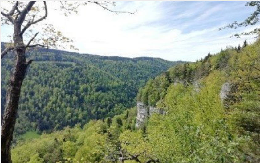
Creux de Hauteroche (CCPSB)