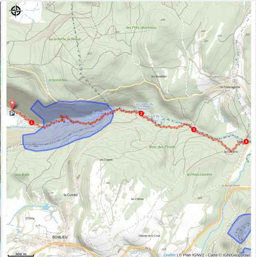
L'Eventail - Cascades du Hérisson

Une randonnée au cours de l'eau Partez pour une balade inoubliable le long du sentier des Cascades du Hérisson, l'un des joyaux naturels du Jura. Sur un parcours de 7,4 km aller-retour, la rivière du Hérisson dévoile 7 cascades spectaculaires dans un cadre préservé et sauvage. Comptez environ 3 heures de marche (aller-retour), ponctuées de points de vue à couper le souffle.