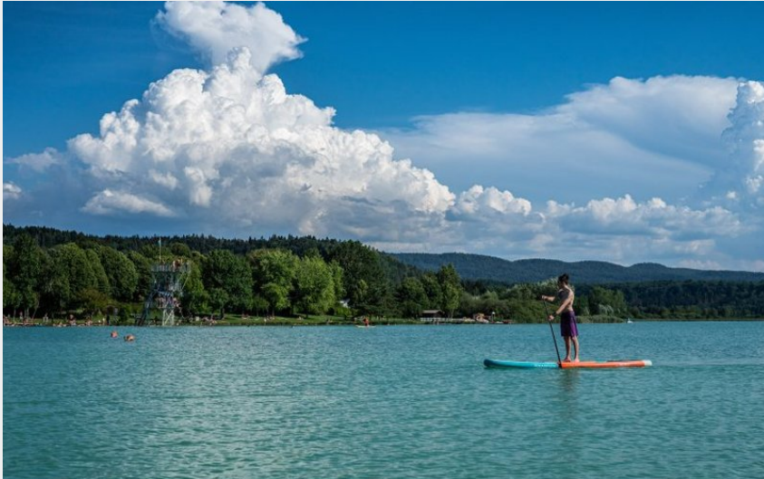
Lac de Clairvaux (OT Clairvaux-les-Lacs)