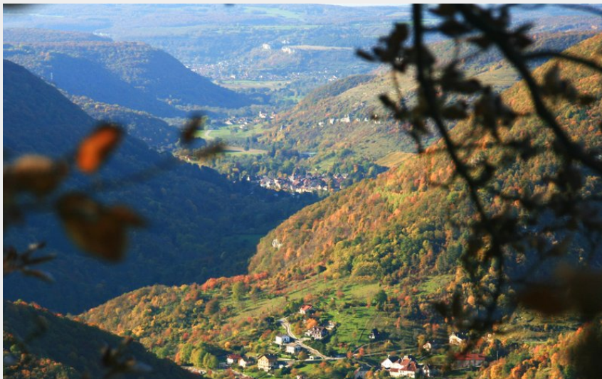
Point de vue du Moine de la Vallée