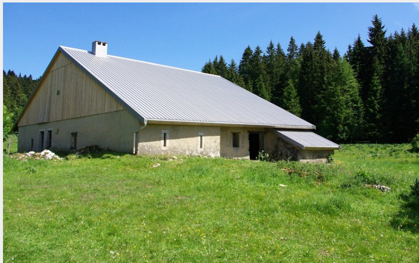
Chalet d'alpage