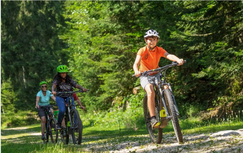
VTT dans la forêt du bois de Croz au dessus de Foncine-le-Haut