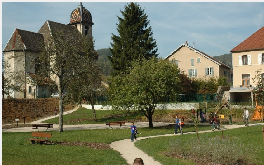
Centre du village