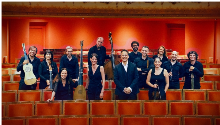
Cappella Mediterranea

Leur production s'inscrit dans le développement de la monodie accompagnée et du langage expressif propre au primo Seicento, où la rhétorique musicale, l'attention au texte et la recherche des affetti occupent une place centrale.