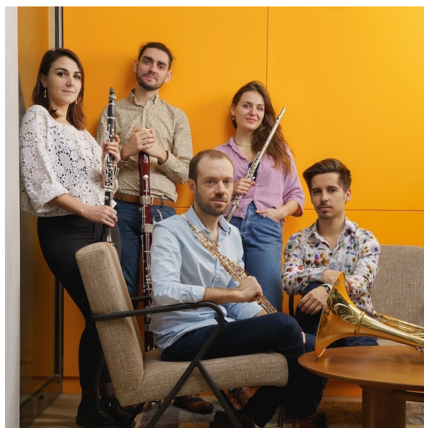
Quintette à Vents Linos

https://www.youtube.com/@QuintetteLinos/shorts