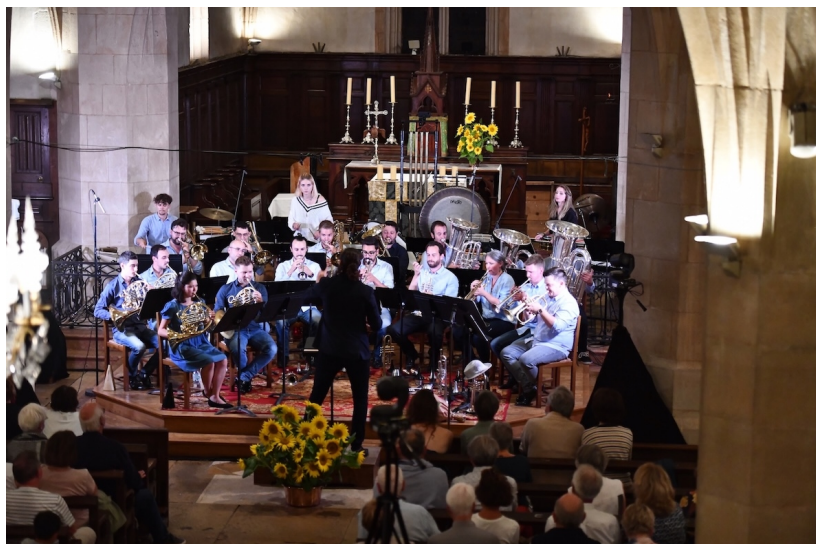
Kaléid Brass