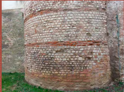
Tour de la voie publique de Chalon