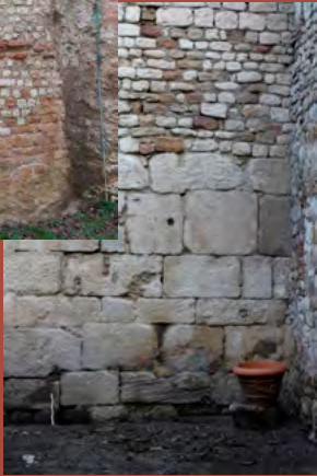
Tour de la voie publique de Chalon