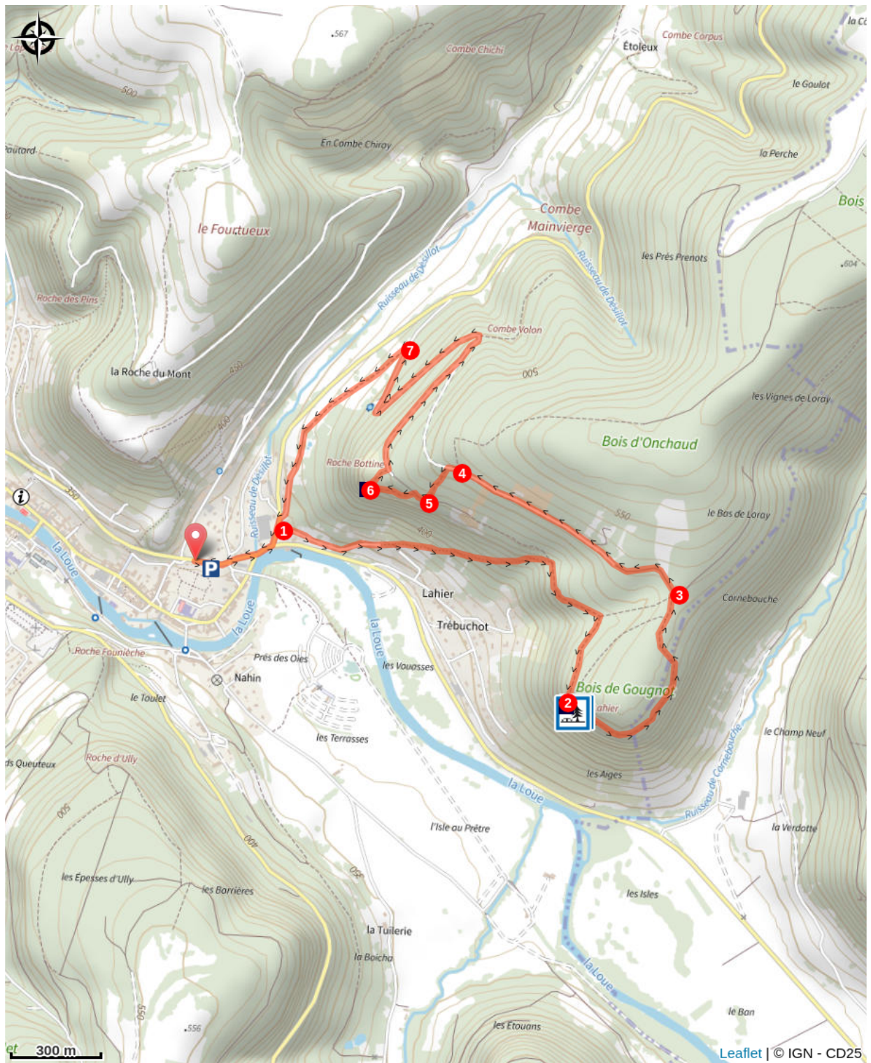
Roche Lahier (A)