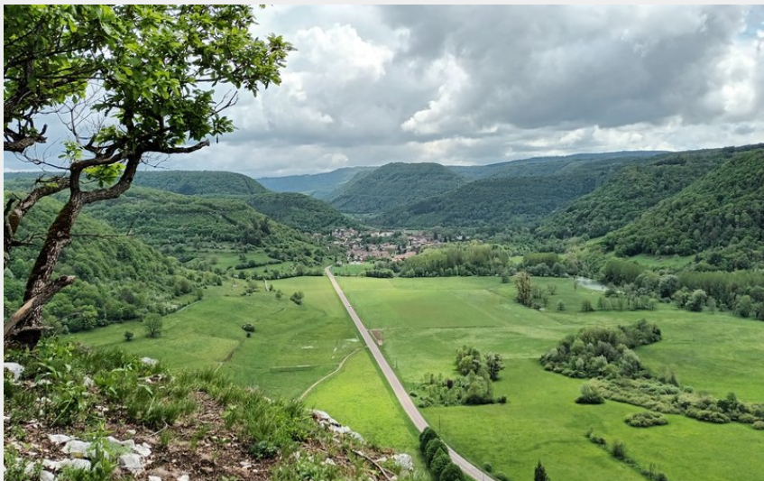
Ornans, Roche Lahier