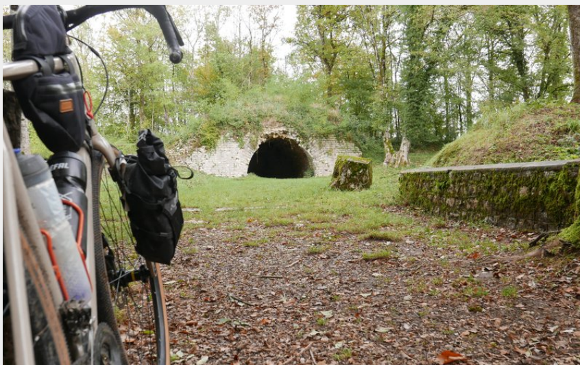
Batterie des Épesses