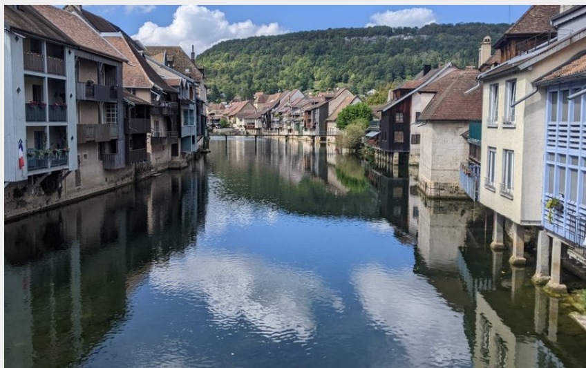
Vue de la Loue à Ornans (CD25)