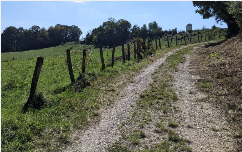
Chemin dans les pâtures (CD25)