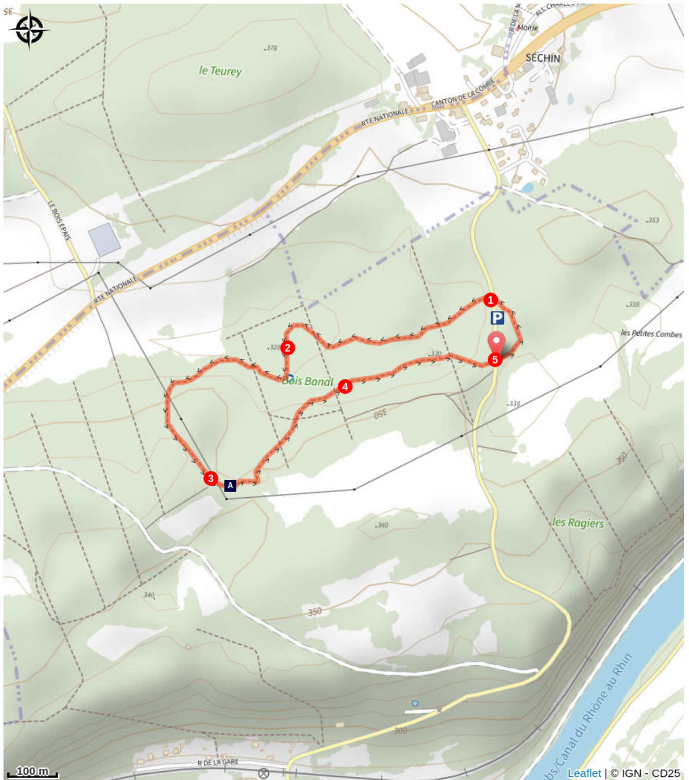
Gouffre du petit Siblot (A)