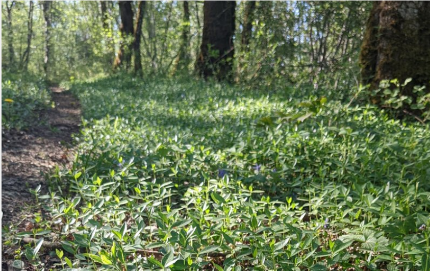
Sentier des dolines (OT Doubs Baumois)