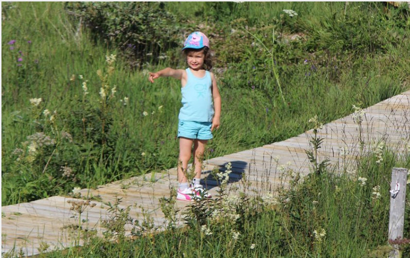
Tourbière de Nanchez (Julien Vandelle)