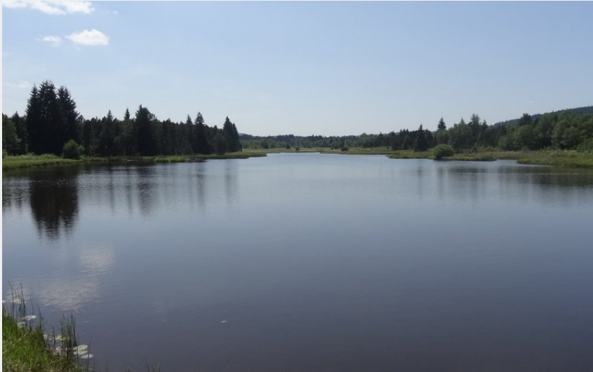
L'étang de Noël-Cerneux (P.Brutot)