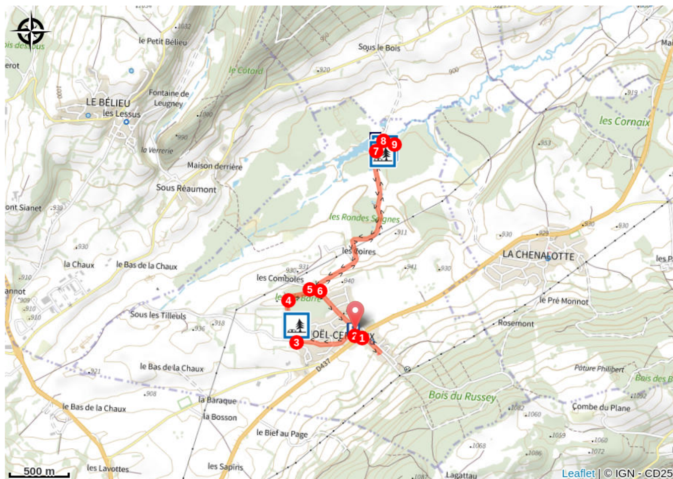
Tourbières des Seignes (A)