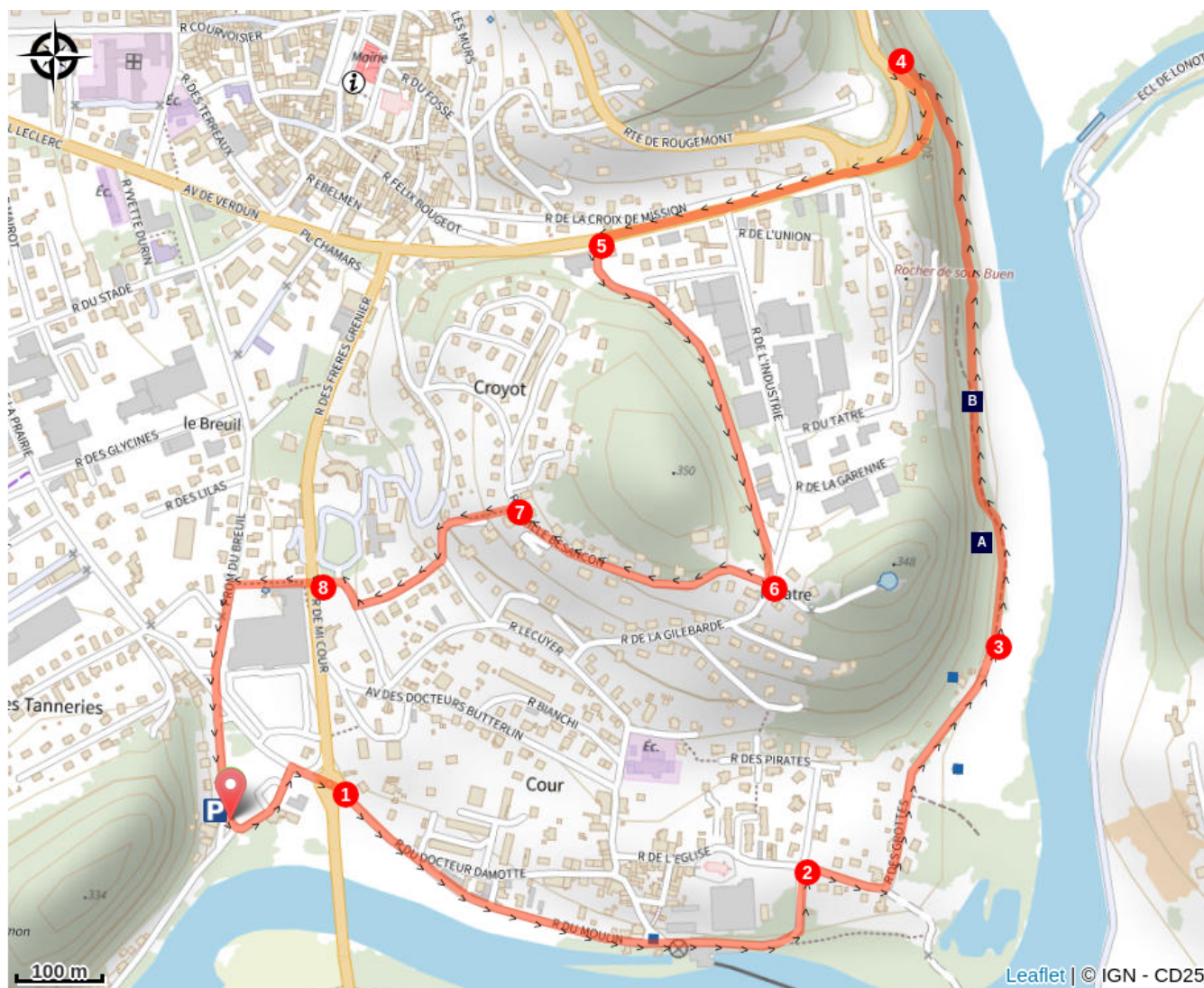
Grotte de Sous-Buen (A)