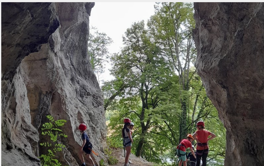
Dans la grotte de Sous Buen (Office de Tourisme du Doubs Baumoisi)