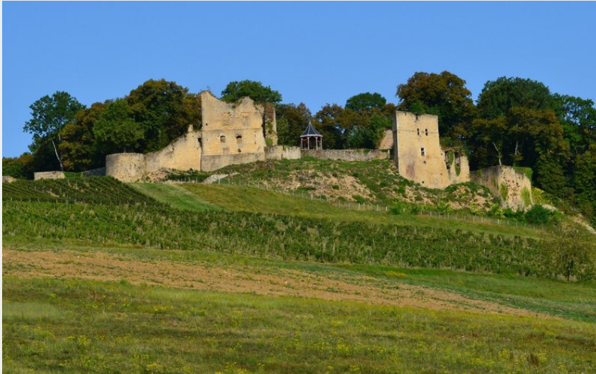
Chateau d'Arlay