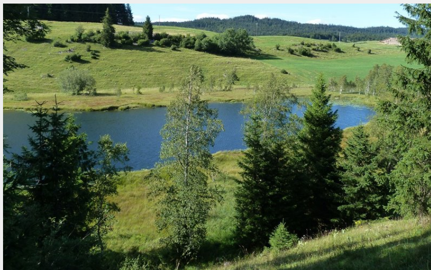
Lac de Reculfoz