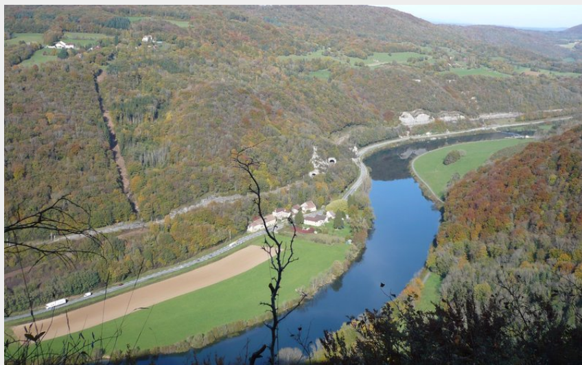
Vue sur la vallée du Doubs