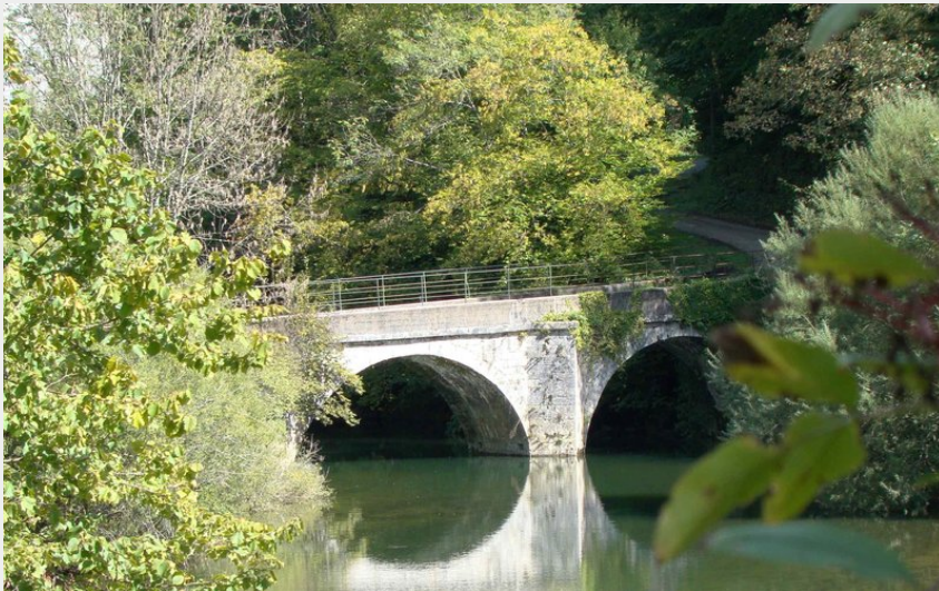
Pont de Battenans et le Dessoubre (P.Brutot)