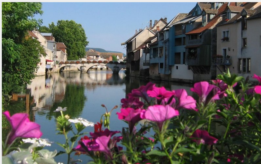
Ornans (Doubs Tourisme)