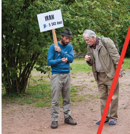
© : Bruno Le Hir de Fallois